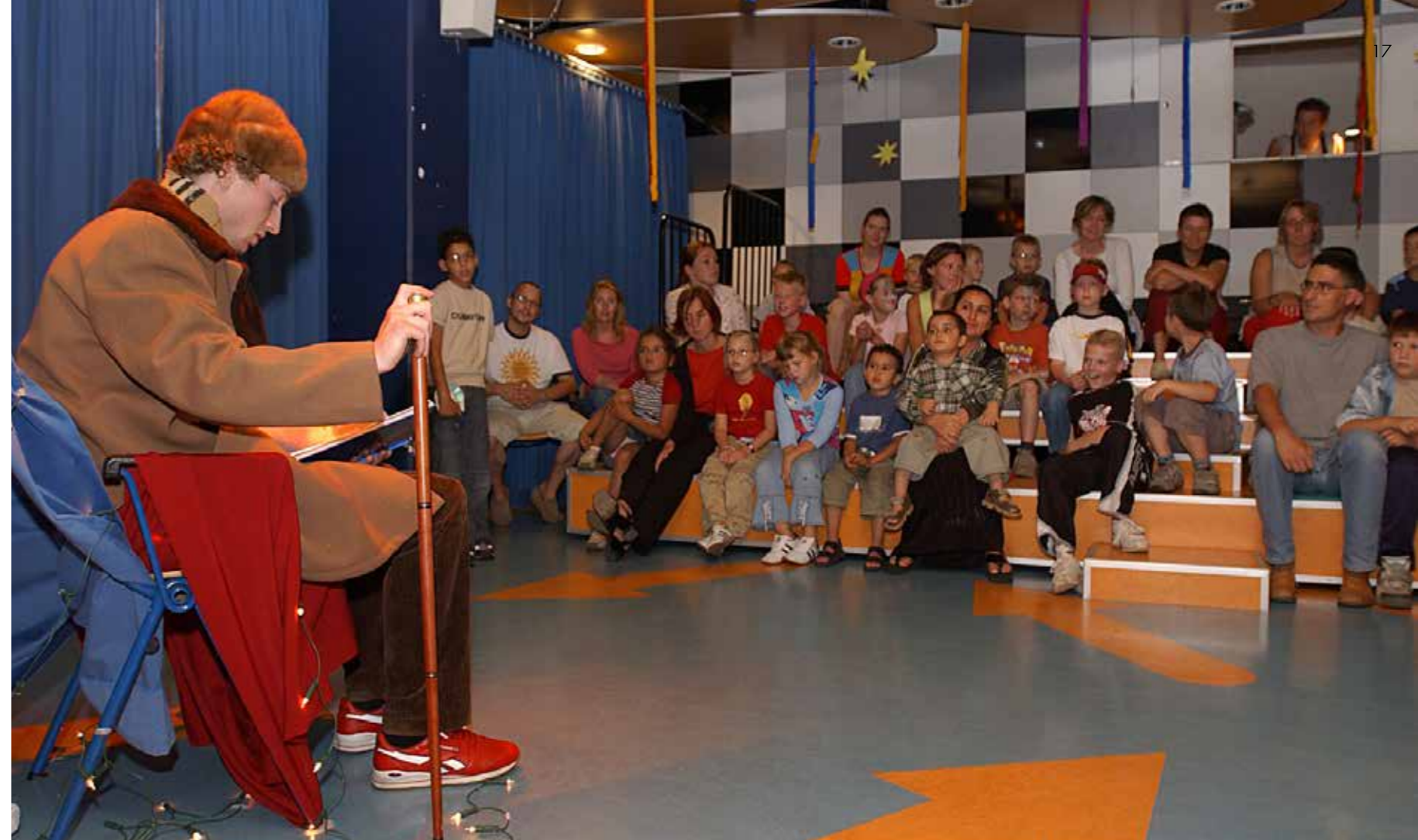
Kerstfeest in het Wilhelmina Kinderziekenhuis Utrecht

Verbinding zoeken betekent in mijn werk bijvoorbeeld ook het samenwerken met collega's met andere levensovertuigingen. Een oecumenisch proces dat buiten het ziekenhuis nauwelijks mogelijk zou zijn. Zo organiseer ik samen met een moslim-collega al een aantal jaar aan het eind van oktober in het kinderziekenhuis 'het feest van het geven'. We kiezen deze periode, omdat ze valt tussen het islamitische offerfeest en het christelijke Sint-Maartensfeest. We hebben een vorm bedacht om de kinderen eens een keer niet de ontvanger van zorg te laten zijn, maar om ze via eigengebakken taart of koek en met zelfgeknutselde kaartjes mensen in het ziekenhuis te bedanken. De dokter, de favoriete verpleegkundige, de pedagogisch medewerker, de eigen ouders. Samen gebakken wordt er in het hele huis, in de speelzalen, maar ook in de afgesloten boxen waarin de heel kwetsbare kinderen verblijven. En uitgedeeld wordt er ook. Dit jaar door een optocht van kinderen, die door het ziekenhuis trok. Met infusen en sondes, met rolstoelen en bedden én met grote hoeveelheden baklava. Een feest waarmee we de kinderen iets ervan laten merken hoe fijn het is om met anderen te delen. Hoe je één met het geheel wordt en daarvoor belangrijk bent. Met of zonder beperkingen. En uiteraard wordt er aan de kinderen een verhaal verteld. Dit jaar over een weerbarstige, kille koning, die tot inkeer kwam na een ontmoeting met een oude gevangene. Met als thema: wie heeft