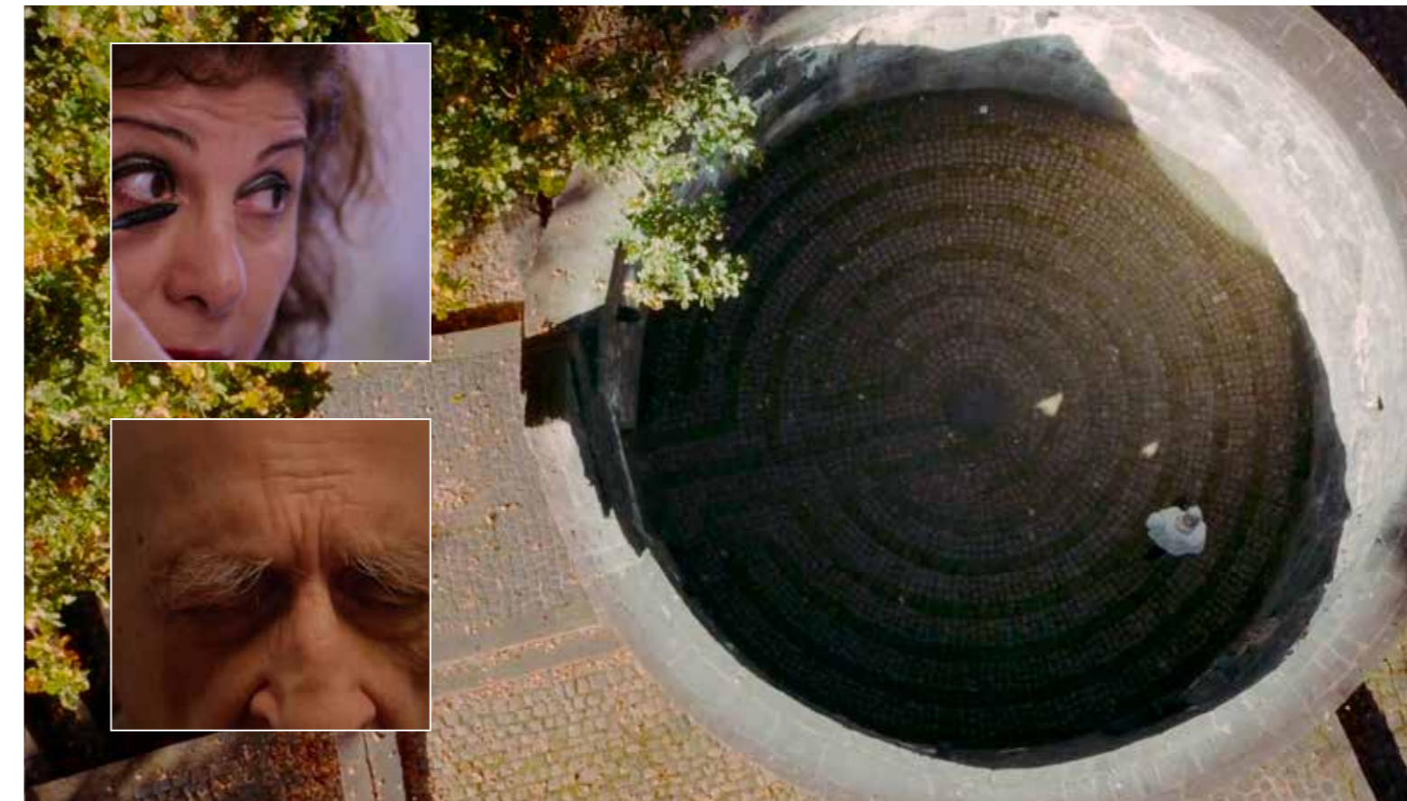
Beelden uit het programma 'Liefde in Tijden van Verwarring'

in Europa tiert het populisme welig. Bij ons staan de verkiezingen voor de deur en moeten alle zeilen bijgezet worden om ervoor te zorgen dat de exploitanten van de angst en de haat niet zullen winnen. Onze gemeenschappelijke verantwoordelijkheid is hoe we, ondanks alle culturele-en religieuze verschillen, kunnen bijdragen aan een samenleving waarin het goed leven is voor iedereen. De kerken vervullen hierbij een belangrijke rol. Zij zijn oefenplaatsen voor verbondenheid en zien het als hun opdracht om aan een inclusieve samenleving te werken. Want, om met Bonhoeffer te spreken, 'de kerk is alleen kerk als zij kerk is met en voor anderen'. Een kerk voor anderen in de eenentwintigste