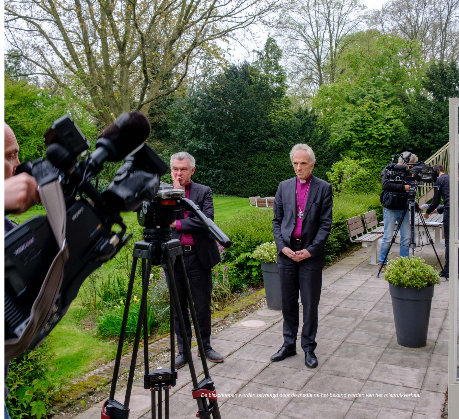
De bisschoppen worden bevraagd door de media na het bekend worden van het misbruikverhaal

Volgens de bisschoppen kan de commissie alles wat zij wil aan de orde stellen, zoals de manier waarop in het verleden met misbruikgevallen werd omgegaan, de huidige 'Procedure voor de behandeling van klachten inzake seksueel misbruik' en in het algemeen de binnenkerkelijke communicatie rond dergelijke gevallen. De bisschoppen hopen, dat de commissie met aanbevelingen komt die onze kerk helpt om misbruik in de toekomst te voorkomen.