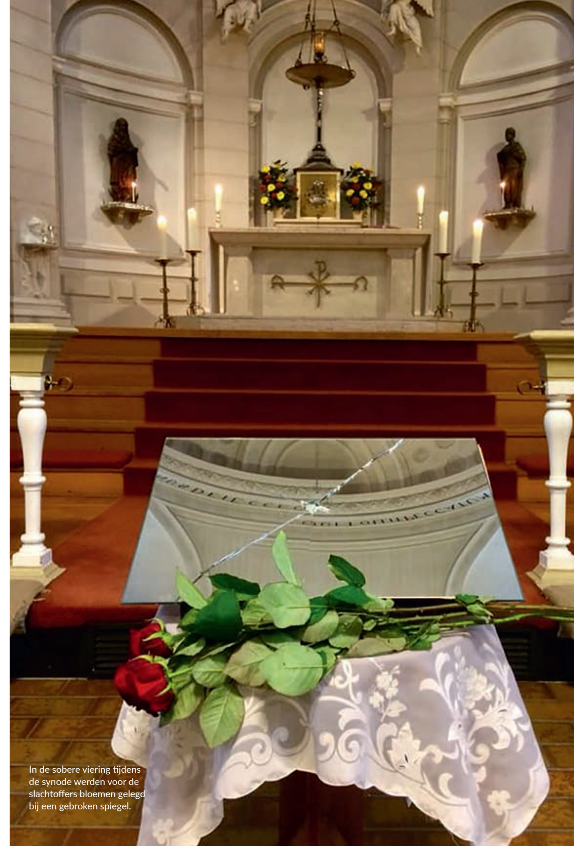
In de sobere viering tijdens de synode werden voor de slachtoffers bloemen gelegd bij een gebroken spiegel.

Hagelslag Vindt de synode dat de bisschoppen moeten aftreden? Een poging tot een meningspeiling over een onduidelijke vraag in dit verband slaat niet aan. Maar het is wel duidelijk dat de meerderheid de bisschoppen niet wil zien vertrekken, vooral uit pragmatische overwegingen. Hun vertrek en de verkiezing van twee nieuwe bisschoppen zou veel stagnatie opleveren. Zij zijn ingewerkt. Zij zijn het