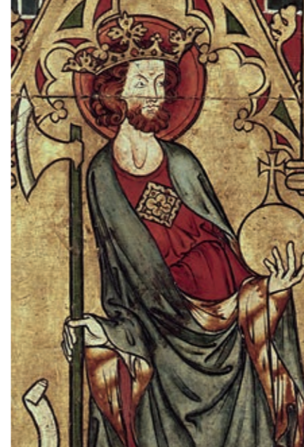
Altaarfrontaal Trondheim Noordwegendetail (www.catharijneconvent.nl/)

'Met grote zorg zien zowel de Rooms-Katholieke Kerk in Nederland als de Protestantse Kerk in Nederland dat het antisemitisme sterker wordt. Telkens zijn er incidenten die ertoe leiden dat een onveilig klimaat kan ontstaan voor de Joodse gemeenschap in Nederland. Dat is ontoelaatbaar. Voor de kerken is het blijvende gesprek met de Joodse gemeenschap in Nederland van groot belang.' Dit staat in een gezamenlijke verklaring van de Rooms-Katholieke Kerk en de Protestantse Kerk in Nederland. Dit jaar worden diverse bijeenkomsten, studiedagen en conferenties gewijd aan het onderwerp antisemitisme. Zo vond dinsdag 25 juni een internationale bijeenkomst over de opkomst van het antisemitisme plaats, die georganiseerd was in samenwerking tussen verschillende politieke partijen, maatschappelijke organisaties en vertegenwoordigers van de Joodse gemeenschap in Nederland. Eerder dit jaar voerde het Centrum Informatie en Documentatie Israël (CID) actie door mensen in ons land te vragen een keppeltje te dragen, iets wat op veel plaatsen lang niet meer vanzelfsprekend is. Daarnaast zijn er politieke initiatieven om antisemitisme tegen te gaan.