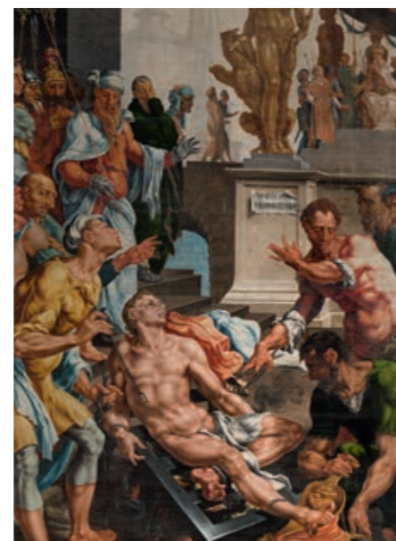
'De dood van Laurentius' fotografie Margreta Svenson

De zijluiken hangen in de Grote Kerk tot 7 oktober. Daarna gaan ze terug naar Zweden. Maar de armen hebben we altijd bij ons.