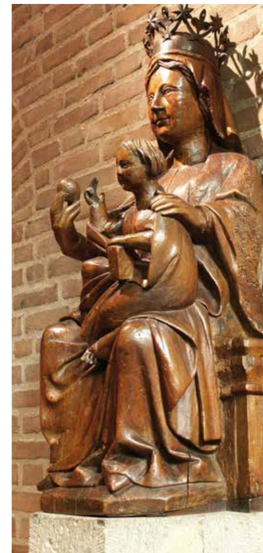
Mariabeeld, ca. 1500-1900, Museum Catharijneconvent