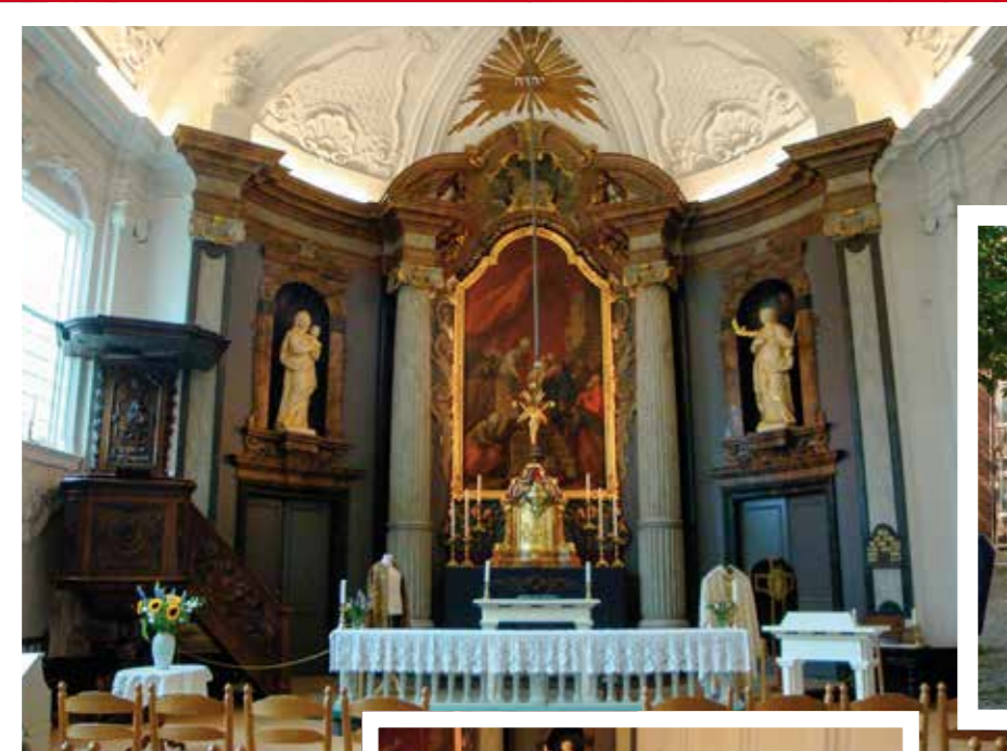
1 - Interieur van onze kerk. Toch de mooiste OK-kerk van NL!