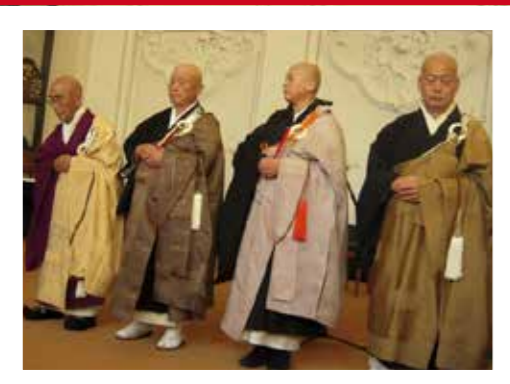
6 - Soms halen we de hele wereld binnen