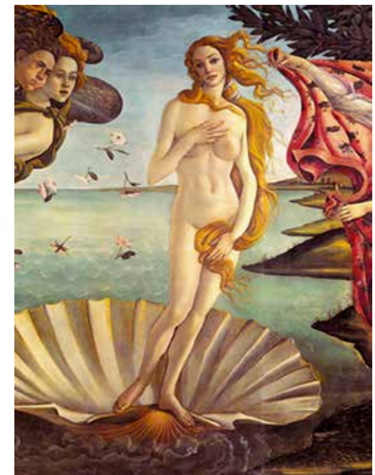
Bewerkingen door ‘Alpha Beauties’