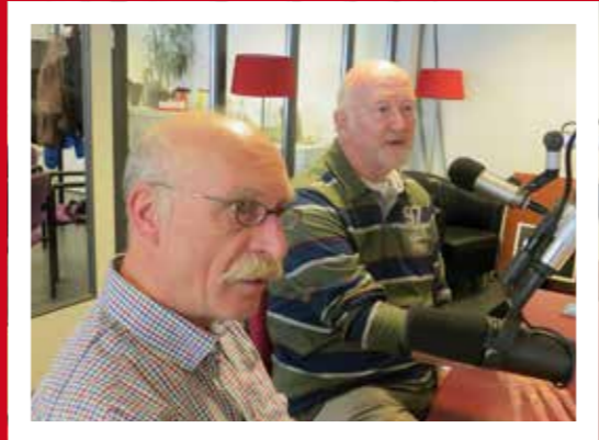
7 - Dan weer gaan we de wereld in via de radio

Naam: Parochie van de H. H. Maria en Ursula. Sinds 1743 aanwezig in het huidige gebouw. Gemiddeld aantal kerkgangers: 15 Website: delft.okkn.nl Kijk op www.okkn.nl voor Het Ding van Delft.