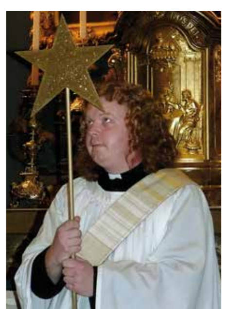
12 - En de pastoor kijkt wel eens de andere kant op...