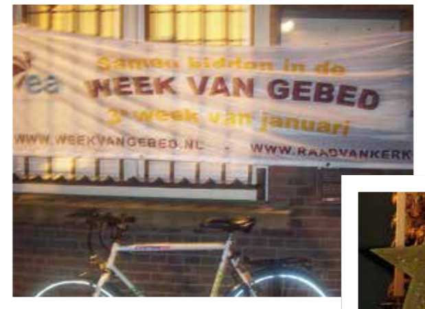
9 - We houden de oecumene hoog