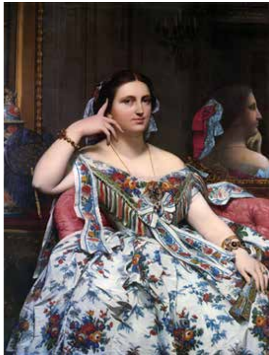
Madame Moitessier, Jean-Auguste-Dominique Ingres, 1856