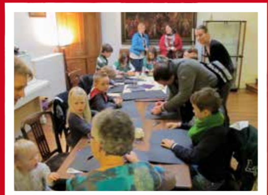
5 - Of we halen de buurt naar binnen