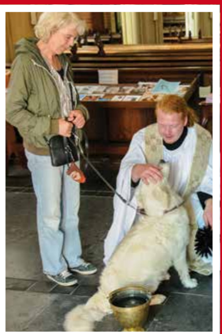
4 - Voor de dierenzegen bij onze roomse zusterkerk