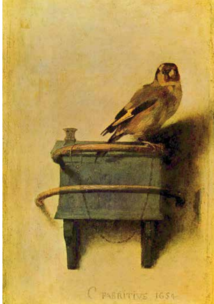
Carel Fabritius; Het puttertje, 1654, Mauritshuis, den Haag

Door recensenten wordt verschillend geoordeeld over het boek. Ik zit dus altijd goed. Ik vind het een prachtig boek. Een boeiend en aangrijpend verhaal, een hoofdpersoon met wie je kunt meeleven en meevoelen, zeer verrassende plotwendingen, mooi taalgebruik met schitterende beelden en intrigerende bespiegelingen over levensbeschouwing, filosofie en kunst.