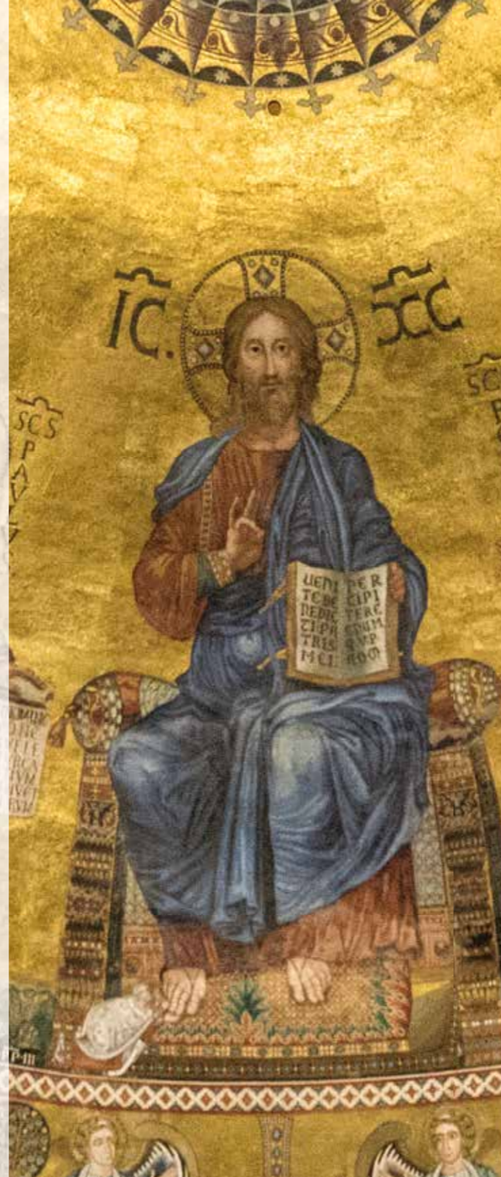
Koepel van St. Paulus buiten de Muren, Rome