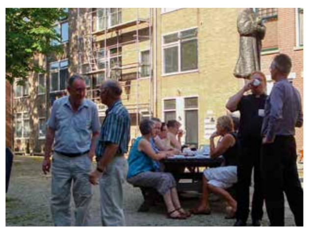
3 - We gaan heel(!) actief naar buiten