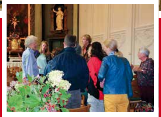
2 - Dat laten we op Monumentendag graag zien!