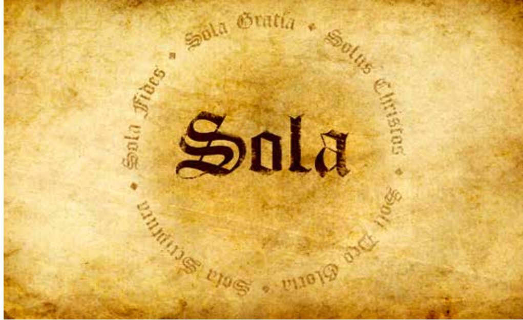
De 'sola's' van de Reformatie

hoogmoed verweten, omdat ze vaak via de hogere klassen van de maatschappij – niet zelden waren jezuïeten biechtvaders van koningen en koninginnen – invloed probeerden uit te oefenen om het protestantisme tegen te gaan. De verdedigers van de traditionele leer van Augustinus benadrukten hiertegen de ernst die het christelijk geloof met zich meebracht: alleen met behulp van Gods genade kon de mens iets goed doen. En om die te verkrijgen, kon men niet teveel vertrouwen op eigen prestaties, want dat zou hoogmoed tegenover God betekenen. Een van de uitvloeisels van deze strengheid was, dat een biechtvader niet te gemakkelijk vergeving van zonde gaf als er geen sprake was van oprecht berouw. De uitkomst van de strijd is bekend: de aanhangers van de traditionele en strenge Augustinus-interpretatie werden in navolging van de Leuvense hoogleraar Cornelius Jansenius (1585-1638) 'jansenisten' genoemd en hun opvattingen, met name inzake de sacramenten van boete en eucharistie, 'rigoristisch'. Uiteindelijk werd Leuven in 1729 gezuiverd van vermeende jansenisten, die voor een deel in de Republiek hun toevlucht zochten.