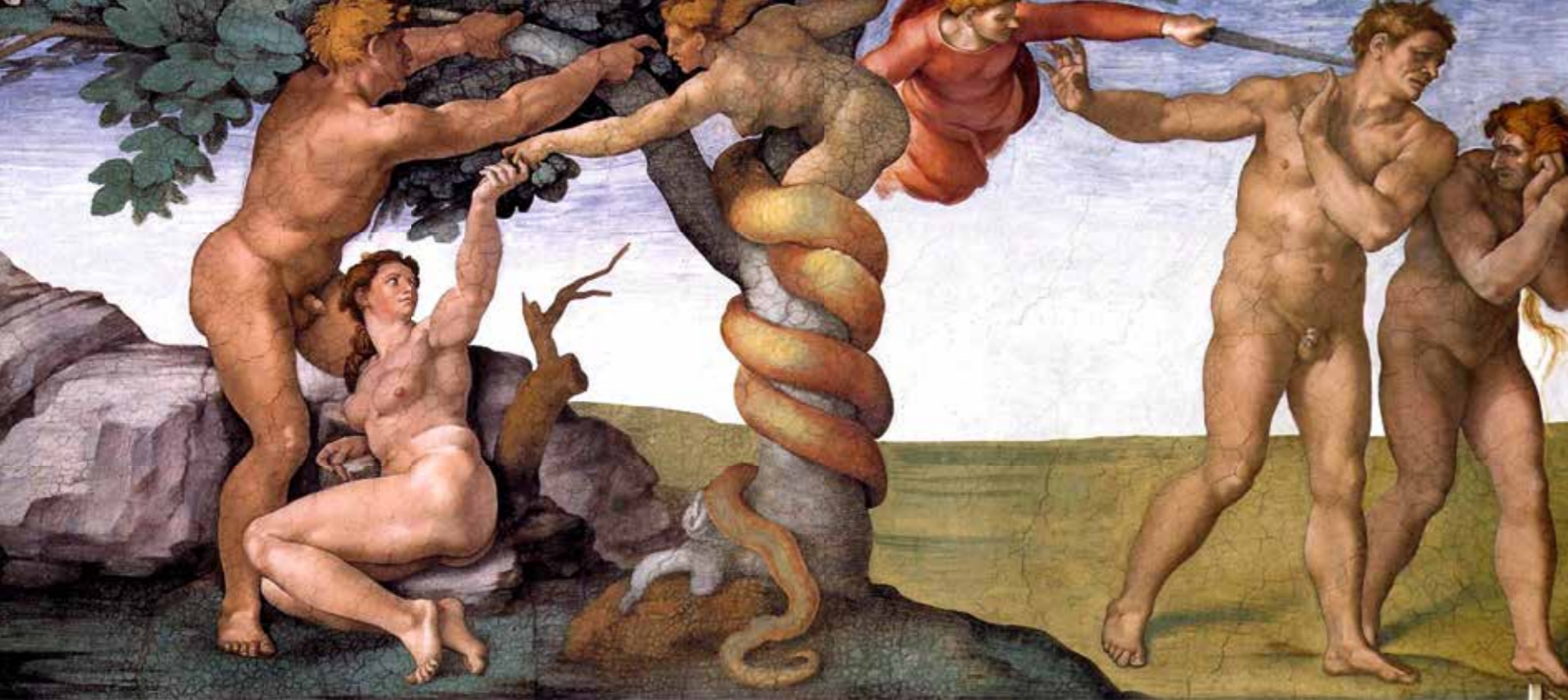
Michelangelo: de Hof van Eden, plafond Sixtijnse Kapel, Rome

hen, iets waarvan zij waren gescheiden. Maar daarna zagen zij goed-en-kwaad niet langer los van zichzelf. Vanwege die vermenging bestaat de noodzaak van de mens om het naakte 'zelf' te bedekken of te verbergen, want het is niet langer enkel en alleen 'goed'. Als de mens zich ertoe zet om de knoop van 'goed-en-kwaad' te ontwarren, raakt hijzelf erin verstrikt.