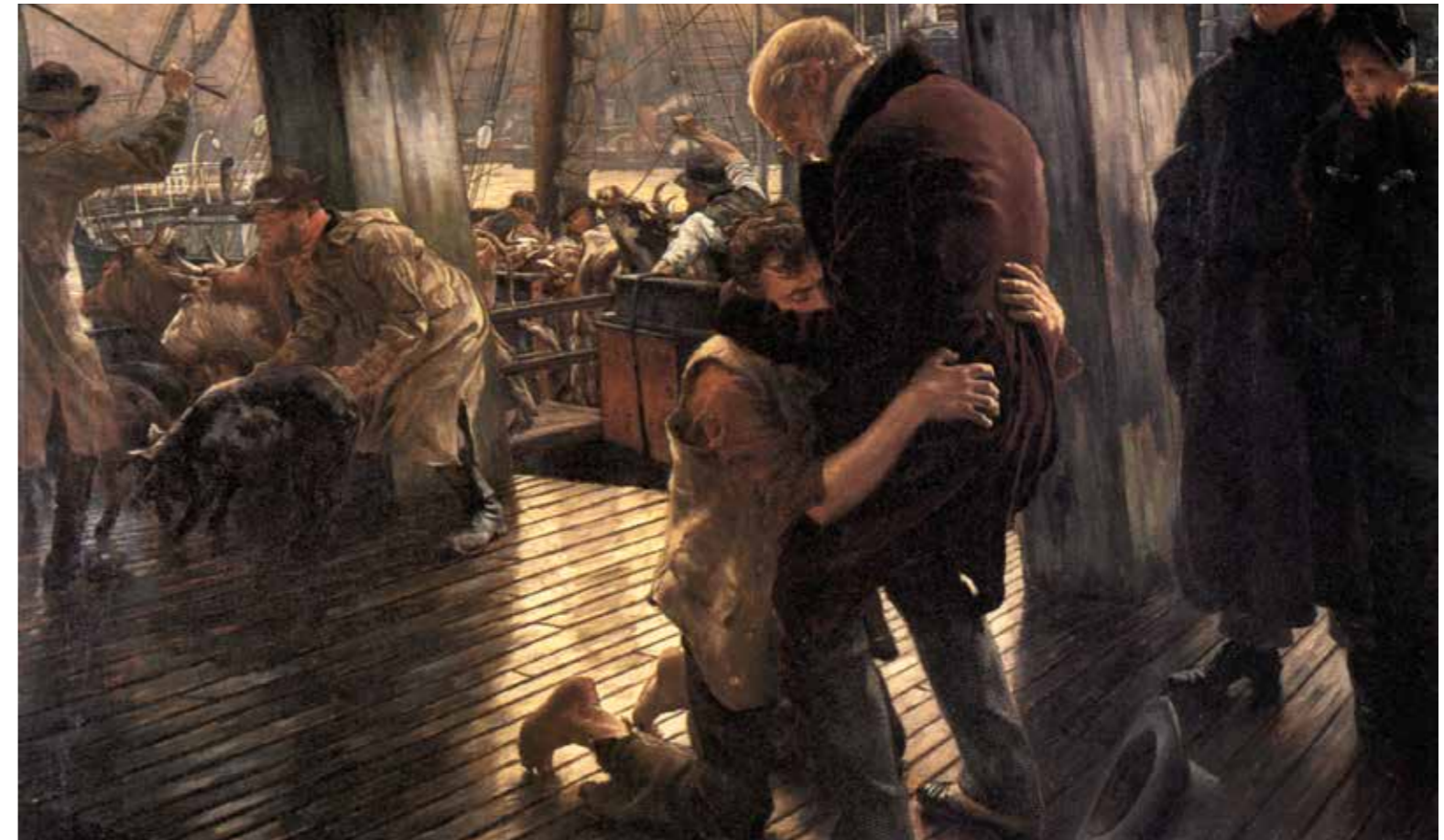
James Tissot (c.1882): De verloren zoon, de terugkeer. National Gallery of Art, Washington, DC, USA

De menselijke natuur heeft er behoefte aan dat die geloofswaarheid ook in woord en daad hoor- en zichtbaar wordt. Op de paasavond heeft Jezus aan de apostelen de dienst van de verzoening gegeven. In zijn naam mogen zij de mens die zich afkeert van het kwade dat hij gedaan heeft, Gods vergeving