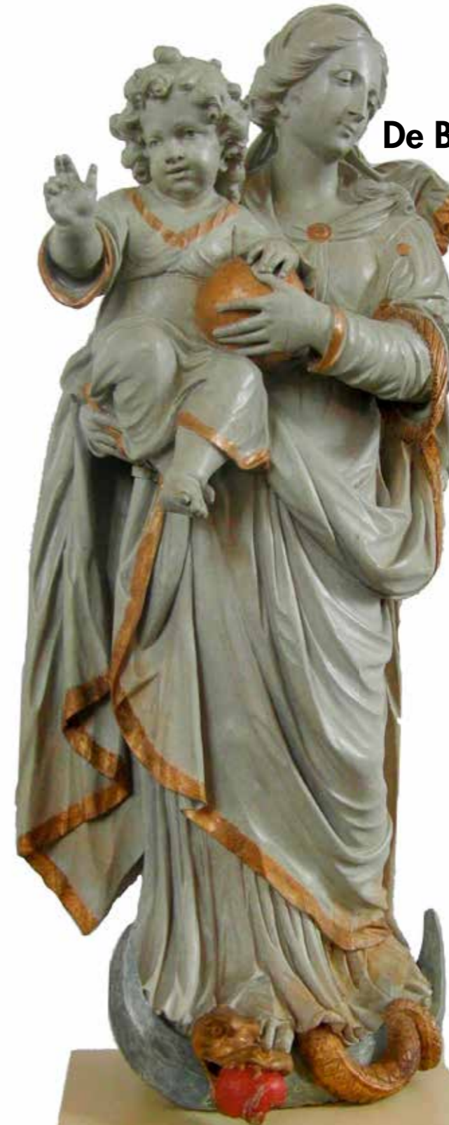
Beeld uit de kerk in Enkhuizen; verbeelding van het kwaad dat de kop wordt ingedrukt

Het kwaad in de wereld is meestal ver weg. Maar plotseling komt het dichtbij en word je er zelf mee geconfronteerd. Niemand wil het kwaad en toch gebeurt het. Het kwaad vormt een bedreiging voor het goede dat God heeft geschapen. De Bijbelverhalen leren hoe het beste met het kwaad kan worden omgegaan. In plaats van kwaad met kwaad te vergelden, wat gebruikelijk is in de wereld, leren christenen dat je beter kunt reageren op een andere manier