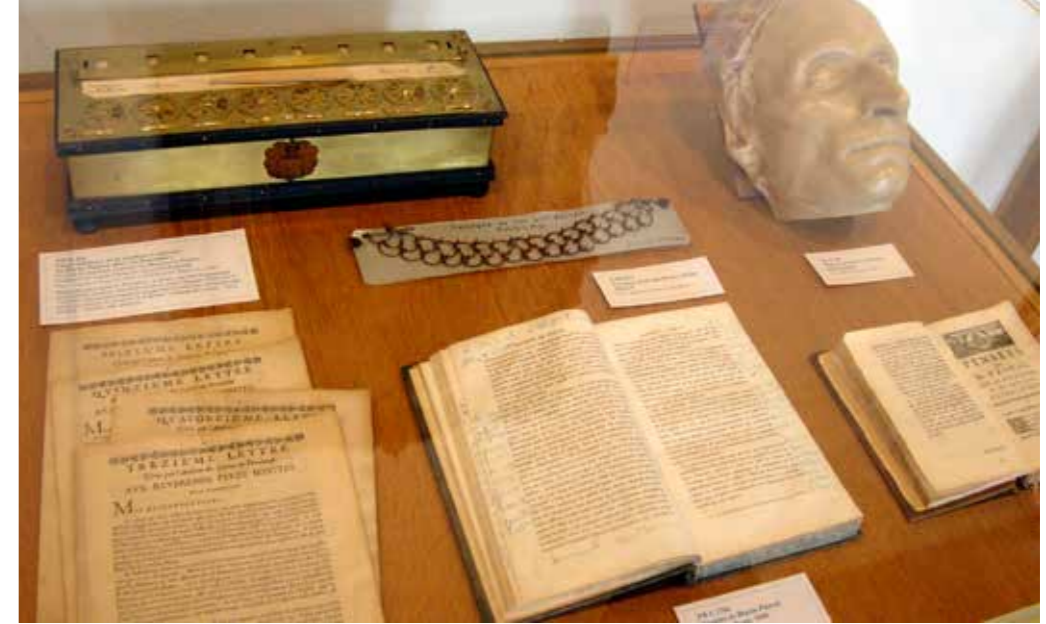
Nu ik dit opschrijf realiseer ik me hoe karakteristiek deze Pascal verzameling is: aan de ene kant die boetegordel waarmee iemand zijn kwade eigenschappen probeert te beteugelen (hetgeen niet getuigt van een optimistisch mensbeeld) en aan de andere kant nuttige dingen als die rekenmachine en polemische geschriften om het geloof zuiver te houden (bewijzen van het tegendeel). Het is kortom een goede mix van bescheidenheid over de eigen kwaliteiten, die een actieve levenshouding volstrekt niet in de weg staat.