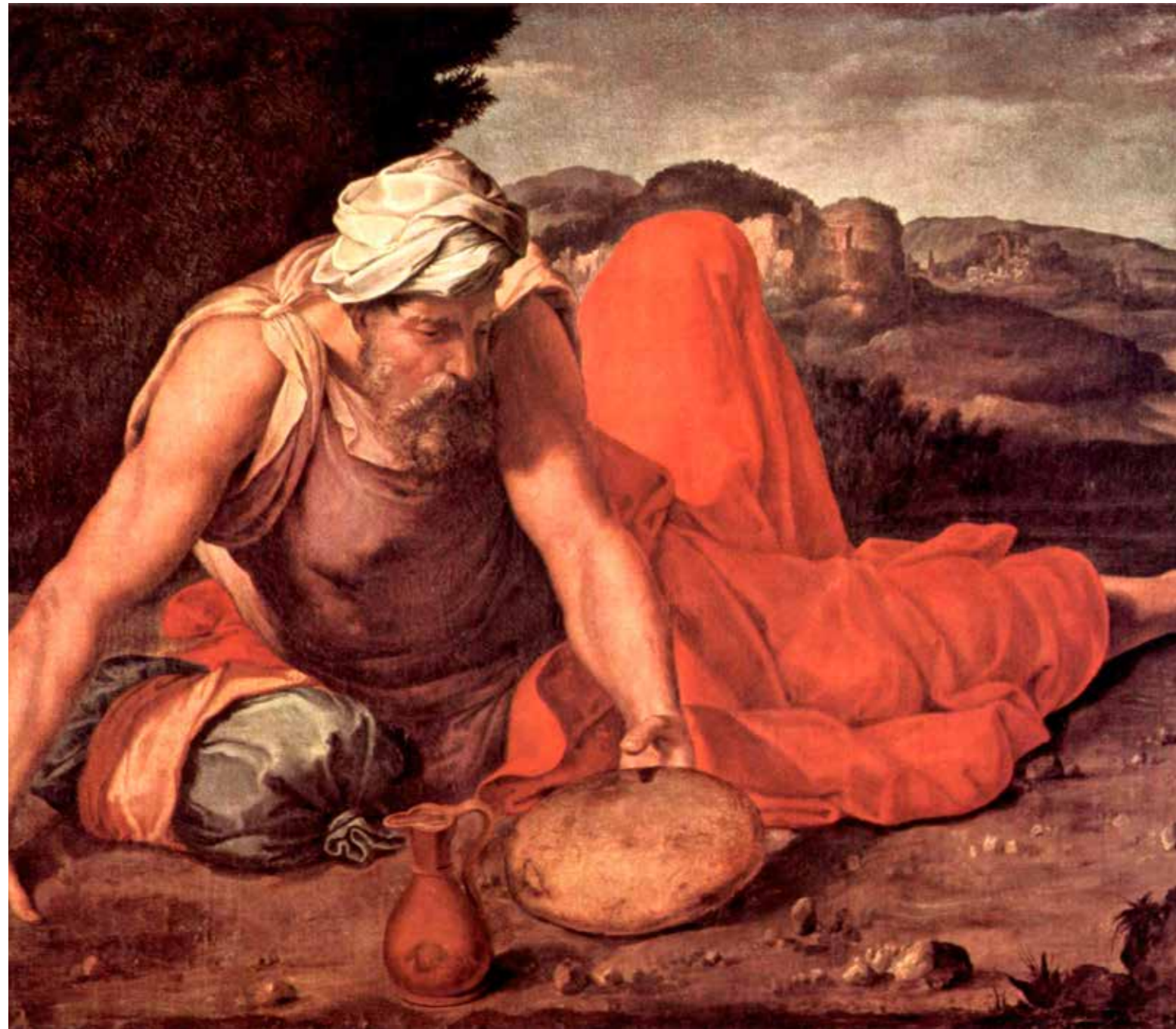
Daniele da Volterra, De profeet Elia, ca.1555