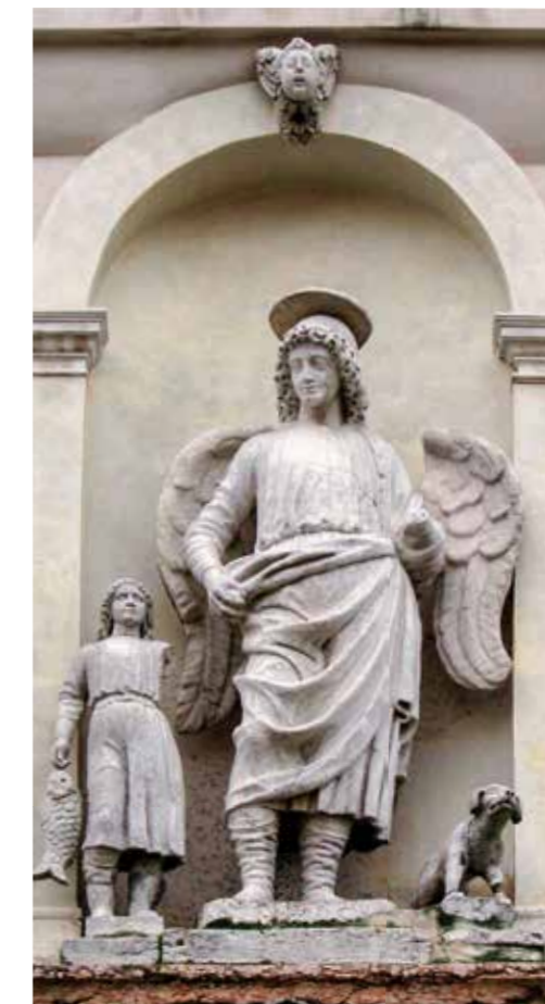
Aan de gevel van de kerk van de engel Rafaël, Venetië

Die openbaring van het goddelijke in ons leven – dat is wat ons het meest kan treffen in dit boek. Zoals Julia bijna aan het mysterie kan raken als ze