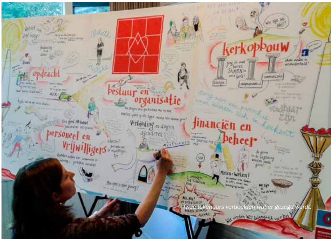
Twee tekenaars verbeelden wat er gezegd wordt.

hebben voor hun verkooppraatje. Na het avondgedenken en wat ontspanning in de bar is de eerste dag voorbij.