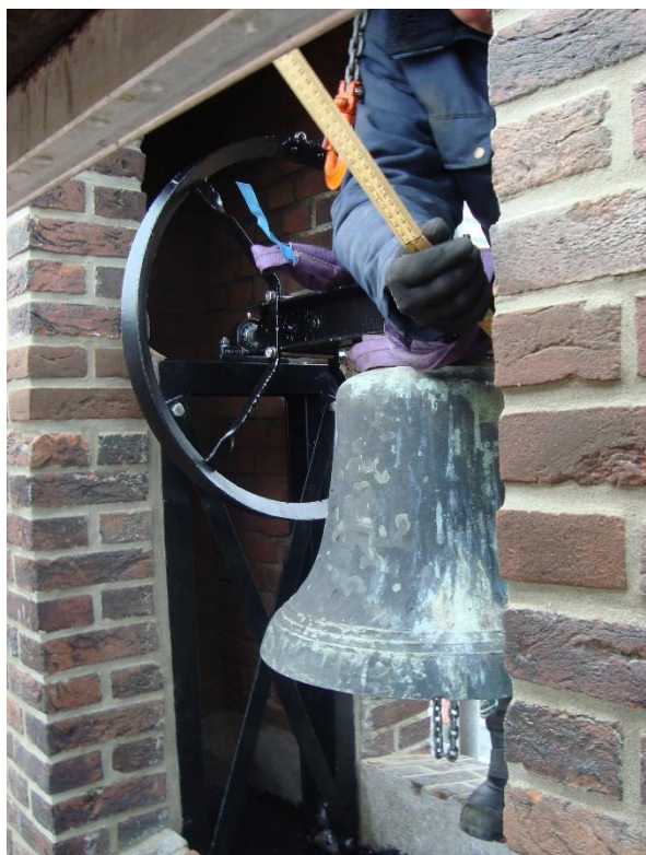
1 - De klok van Arnhem kreeg een nieuwe klokkenstoel en klepel. Het groot-onderhoud is afgerond.

De arbeidsvoorwaarden worden elk jaar aangepast aan de eisen die onder andere de overheid stelt. Dit jaar was er een aanpassing van de onkostenvergoedingen. Ook de wijze waarop de zorgverzekering collectief werd geregeld is veranderd.