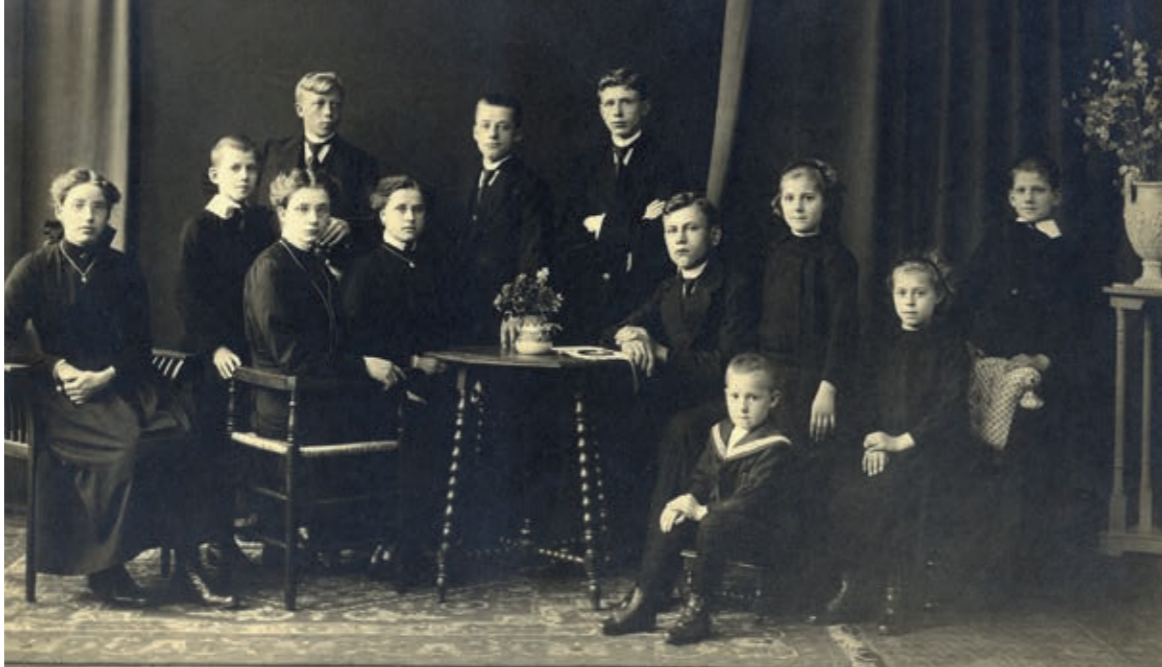
Groepsfoto van de wezen uit het weeshuis, ca 1900

vrouwen zonder geldige verblijfspapieren en hun kinderen. Dankzij de ORKA kan aan deze kwetsbare groep net iets extra's geboden worden, bijvoorbeeld een week kamperen op een afgeschermd deel van een camping. Een ander voorbeeld is Stichting IMC Weekendschool Utrecht, die verrijking op het reguliere onderwijs aanbiedt. Kinderen maken in weekenden themagericht kennis met bijvoorbeeld de bouw, de rechtspraak of de zorg. Mensen uit het werkveld vertellen erover en nemen hen mee naar bijvoorbeeld de rechtbank. De regenten zijn er enthousiast over: "Je kunt er nooit een onvoldoende halen, of zakken: je hoeft het alleen maar leuk te vinden en ervan te leren." Het ORKA-bestuur probeert de organisaties of fondsen waaraan zij geld geven een keer per jaar te ontmoeten. Om die reden kiezen zij voor een beperkt aantal doelen, dat zij gedurende een aan-