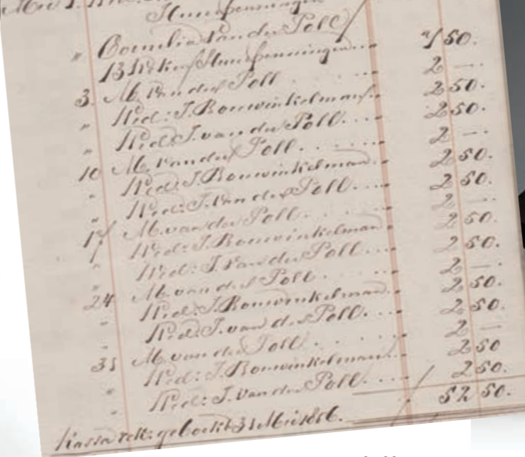
Bedeelden 1856 Brouwersgracht Amsterdam

van het gezin en gebreken. Op woensdagmiddag vond om de week de uitdeling plaats. Kraamvrouwen kregen een toelage en zieken die naar een gasthuis moesten worden gebracht, kregen geld voor 'eene toeslede en eene verschooning', vervoer en een schone pyjama dus. De stichting beheerde vier hofjes in de stad en kreeg haar geld door giften, legaten en door collecten langs de deuren en in de kerken. Dat was ook wel nodig ook, want waar in 1835 nog 5.998 mensen werden bedeed, was dat aantal in 1845 naar 8.408 gestegen en in 1850 naar 9.092.