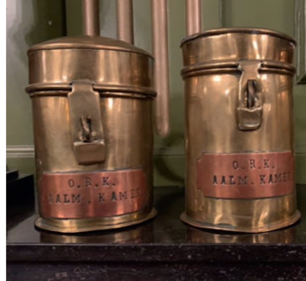
Bussen voor collectes in de kwartieren (wijken)

De regentenkamer bevindt zich in een bijgebouw van de vroegere Mariakerk. Van deze kerk resteert alleen de pandgang (kloostergang) en het 'choraalhuis', waar vroeger de koorzangers werden geschoold. Beide stammen uit 1100, al is het choraalhuis in de loop van de eeuwen enkele malen aangepast. Dit gedeelte van de stad, waar ook