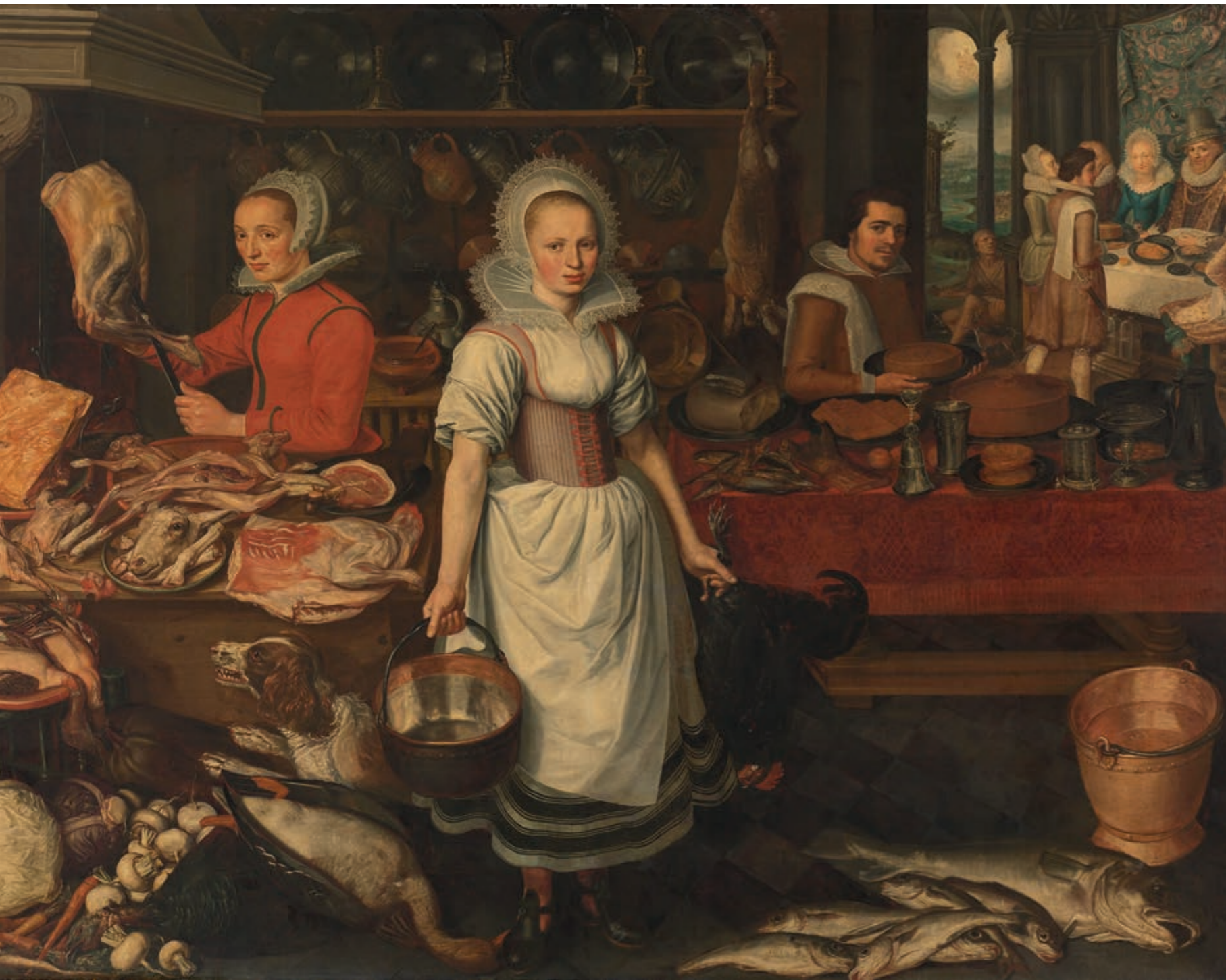
Pieter Cornelisz van Rijck : keukenscène met de gelijkenis van de rijke man en de arme Lazarus, rechts op de achtergrond de rijke man met zijn gezin aan een banket, bij de deur zit Lazarus op de vloer.

onbetaald werk verrichten, zoals zorgtaken en schoonmaaktaken voor de familie. Dit systeem schept een kloof voor vrouwen om deel te nemen aan de economie. Vanwege die zorgtaken heeft in ontwikkelingslanden 42 procent van de vrouwen geen betaalde baan. Onder mannen is dit maar 6 procent. Reden waarom in die landen vrouwen en meisjes het overgrote deel uitmaken van de mensen die leven in armoede.