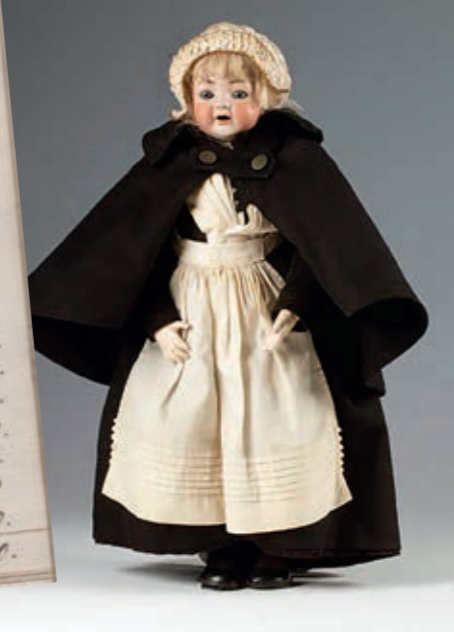
Pop met kostuum van weesmeisje van het Oud-Katholiek Weeshuis te Utrecht