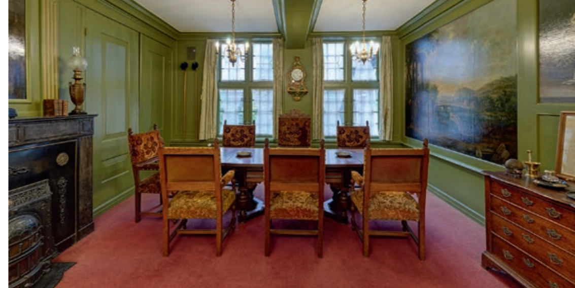
Regentenkamer van de ORKA in 17e eeuwse stijl, met geschilderde wandversiering

de Gertrudiskapel zich sinds 1634 als schuilkerk bevond, was na de overgang van Utrecht tot de Reformatie in 1580 een katholiek gebied gebleven. De armenzorg in Utrecht, uitbesteed aan de gereformeerde diaconie, bleek zich in de praktijk te beperken tot de protestantse inwoners. Omdat de nood onder katholieke inwoners hoog was, helemaal na de cycloon die niet alleen het schip van de Dom maar ook veel huizen in de stad verwoestte, richtten enkele welgestelde Utrechtse in 1674 de 'Rooms-Catholieke Aelmoessenierskamer' op. Van schenkingen, collectes en erfenissen werd bedeed. In geld en natura werden uitkeringen verstrekt en schuldenproblemen opgelost. Een apotheker, Willem Heijendaal, bracht veel van het startkapitaal in en vormde samen met zijn zwagers het bestuur. Van de achttiende-eeuwse Johannes Heijendaal, die jarenlang regent was en landerijen schonk aan de Aalmoezenierskamer, is nog steeds een grafsteen te zien in de pandgang. In deze afgesloten kloostergang zijn veel bisschoppen, priesters, kloppers (gewijde lekenvrouwen), 'orvalisten' (vluchtelingen van Port Royal) en vooraanstaande leken van de cleresie begraven. Na de splitsing van de katholieken in een groep die Rome volgde en de groep die koos voor de Rooms-Katholieke Kerk der Oud-Bisschoppelijke Cleresie, bleek het niet mogelijk eendrachtig verder