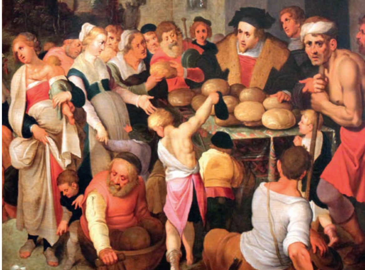
Detail 'Werken van Barmhartigheid', Frans Francken